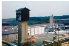
HW K3I-D02 (Ausschnitt bearb., 06.1985,