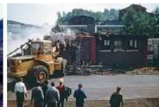
HWK1.1re-D36 (Abriss Badhaus).tif.jpg