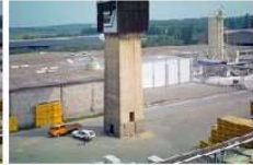
HW K3I-D01 (Ausschnitt bearb.,