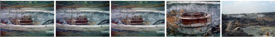
HW K3re-D39.tif-0.jpg HW K3re-D39.tif-1.jpg HW K3re-D39.tif-2.jpg HW K3re-D40.tif.jpg HW K3re-D41 (Ep).tif.jpg