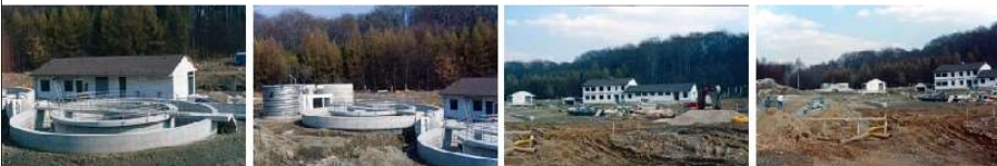
HW K3re-D44.tif.jpg HW K3re-D45.tif.jpg HW K3re-D46.tif.jpg HW K3re-D47.tif.jpg