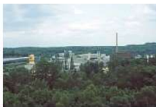
HW K3re-D02 (Ausschnitt bearb.,