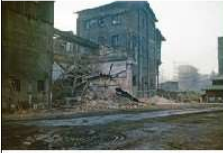
HW K2I-D27 (Abriss alte