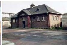
HWK1.1I-D14 (altes Badhaus).tif.jpg