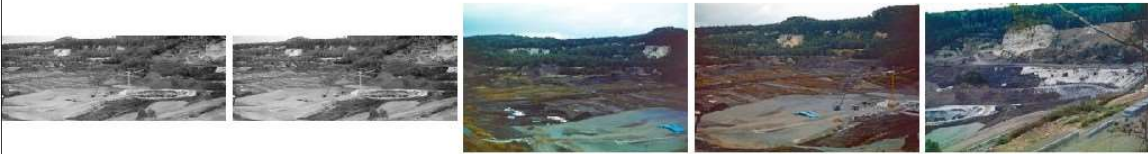
HW K3re-D35_HW K3re-D35&37 HW K3re-D35_HW K3re-D35&37 HW K3re-D36.tif.jpg HW K3re-D37.tif.jpg HW K3re-D38.tif.jpg