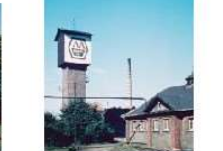
HWK1.1I-D30 (Ausschnitt bearb.).tif.jpg