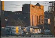
HW K2re-D15 (Ausschnitt