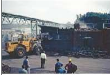
HW K1.1re-D37 (Abriss Badhaus).tif.jpg