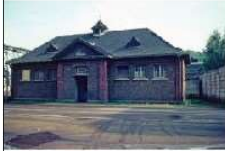
HW K1.1re-D43 (altes Badhaus).tif.jpg