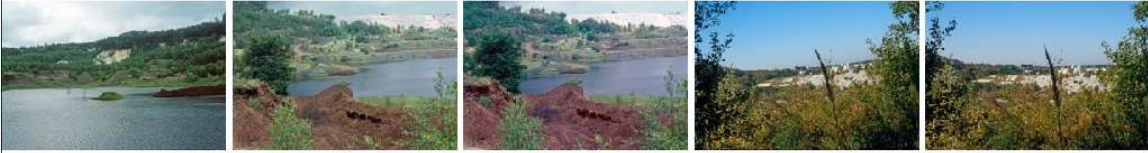
HW K3re-D15 (08.1982)(Ep).tif.jpg HW K3re-D16 (08.1982)(Ep).tif.jpg HW K3re-D16 (08.1982)(N).tif.jpg HW K3re-D19 (05.1998).tif.jpg HW K3re-D19 (Ausschnitt bearb.,