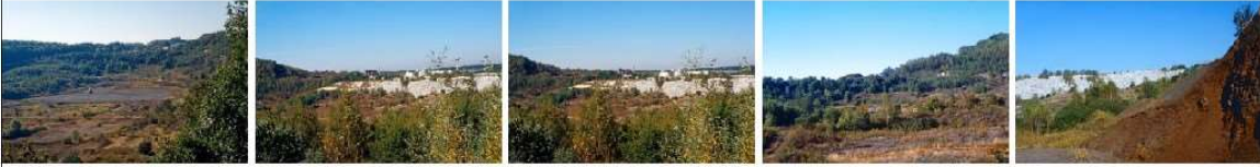
HW K3re-D20 (05.1998).tif.jpg HW K3re-D21 (05.1998).tif.jpg HW K3re-D21 (Ausschnitt bearb., HW K3re-D22 (05.1998).tif.jpg HW K3re-D23 (05.1998).tif.jpg