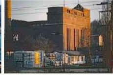
HW K2re-D15 (Ausschnitt