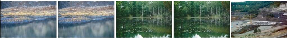
HW K3re-D33.tif-0.jpg HW K3re-D33.tif-1.jpg HW K3re-D34.tif-0.jpg HW K3re-D34.tif-1.jpg HW K3re-D35.tif.jpg